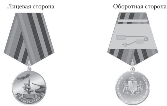
РИСУНОК Памятного знака Губернатора Ульяновской области «В память о праздничном параде в Ульяновской области в день 75-летия Победы советского народа в Великой Отечественной войне 1941-1945 годов»