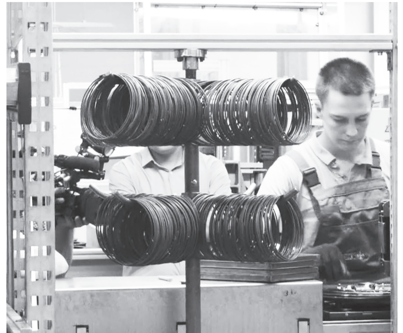
Первый в России завод по производству автокомпонентов (сцепления, детали коробки передач, подшипники и т.д.) немецкой компании Schaeffler был открыт в Ульяновской области в индустриальном парке «Заволжье» 10.10.2014 г. Общая сумма инвестиций превысила 2 млрд руб.

Напомним: Ульяновская область приступила к досрочной реализации отдельных мероприятий национального проекта «Производительность труда и поддержка занятости». Изначально плановый год вступления региона в нацпроект - 2021-й. В рамках подписанных соглашений областные предприятия получают доступ к